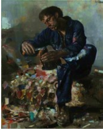
12. „Das Scheitern“ Öl auf Baumwolle, 2011 100 x 80 cm Lager-Nr. RK 292