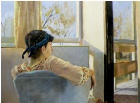
17. ohne Titel (Sitzende) Öl auf Baumwolle, 2007 60 x 80 cm Lager-Nr. RK 281