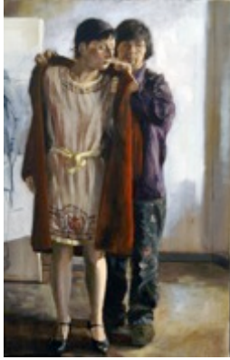
16. „Der Mantel“ Öl auf Baumwolle, 2010 69,5 x 45 cm Lager-Nr. RK 4