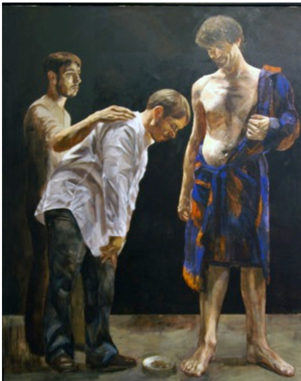
15. „David und Goliath“ Öl auf Baumwolle, 2010 200 x 160 cm Lager-Nr. RK 2