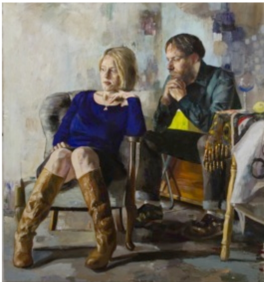
5. „Die Lügner“ Öl auf Baumwolle, 2011 140 x 130 cm Lager-Nr. RK 79