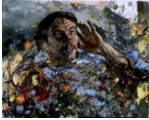
11. „Der brennende Dornbusch“ Öl auf Baumwolle, 2011 40 x 50 cm Lager-Nr. RK 291