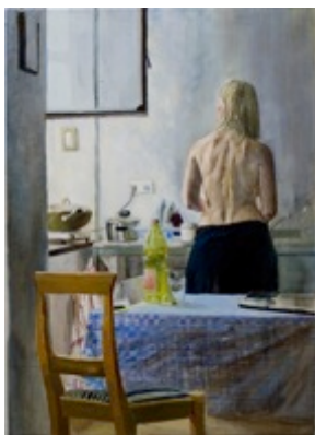
19. „Der Vormittag“ Öl auf Baumwolle, 2010 69,5 x 50 cm Lager-Nr. RK 7