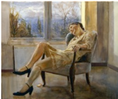
18. „Der Gedanke“ Öl auf Baumwolle, 2010 50 x 60 cm Lager-Nr. RK 5