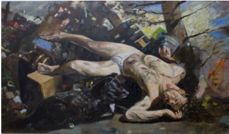
14. „Der Strolch“ Öl auf Baumwolle, 2010 140 x 240 cm Lager-Nr. RK 1