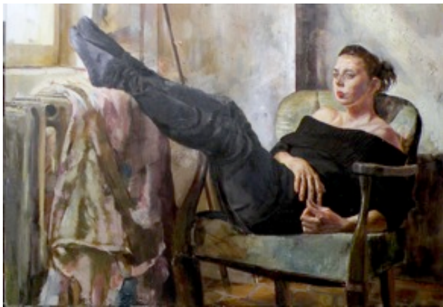
9. „Maja“ Öl auf Baumwolle, 2011 100 x 140 cm Lager-Nr. RK 289