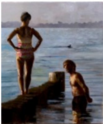
10. „Johannes der Täufer“ Öl auf Baumwolle, 2011 60 x 50 cm Lager-Nr. RK 293