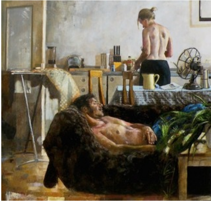
4. „Jakobs Traum II“ Öl auf Baumwolle, 2011 170 x 180 cm Lager-Nr. RK 285