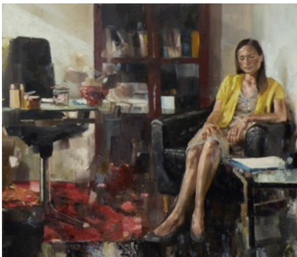
6. „Die Sitzung“ Öl auf Baumwolle, 2011 130 x 150 cm Lager-Nr. RK 286