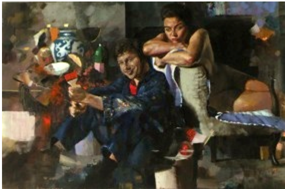
1. „Maler und Modell“ Öl auf Baumwolle, 2011 100 x 150 cm Lager-Nr. RK 282