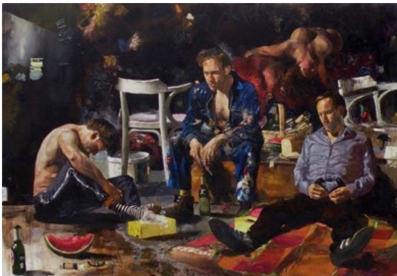
2. „Das Verbrechen“ Öl auf Baumwolle, 2011 150 x 220 cm Lager-Nr. RK 283