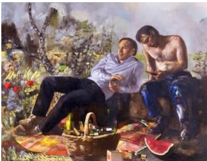
3. „Jakob und Esau“ Öl auf Baumwolle, 2011 140 x 180 cm Lager-Nr. RK 284