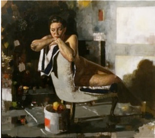
8. „Der Tag im Sessel“ Öl auf Baumwolle, 2011 130 x 145 cm Lager-Nr. RK 288