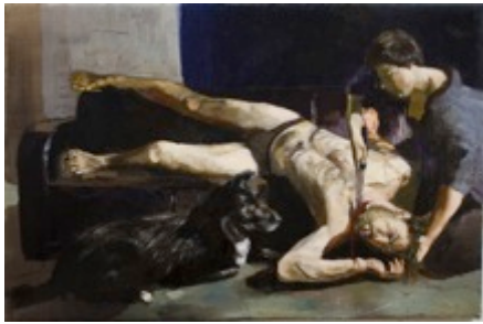
13. „Judith und Holofernes“ Öl auf Baumwolle, 2010 40 x 60 cm Lager-Nr. RK 6